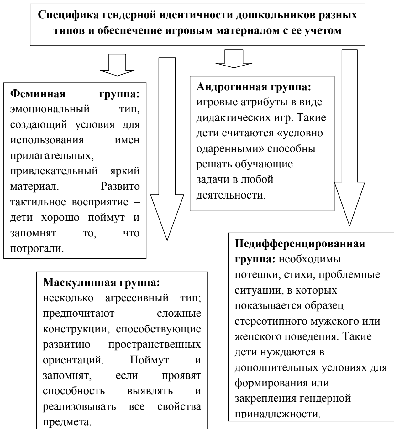
Рисунок 1. Специфика организации игровой деятельности детей разных типов полоролевых предпочтений

особенности детей каждого типа определяют специфику их игровой деятельности. На рисунке 1 показана специфика организации игровой деятельности детей разных типов полоролевых предпочтений.